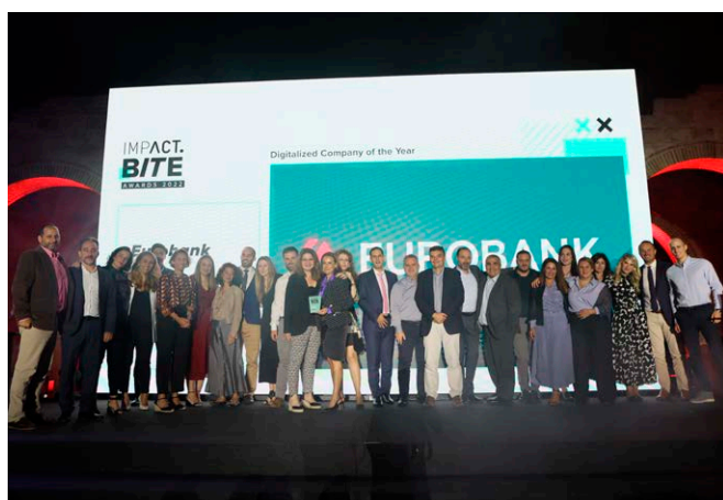
Eurobank, Digitalized Company of the year

Τα 4 Platinum βραβεία, για τα έργα που απέσπασαν την υψηλότερη βαθμολογία από την επιτροπή αξιολόγησης έλαβαν: i) η Διαμαντής Μασούτης και η RealMint, spin off του ΑΠΘ για το MasRFS, το Σύστημα Τεχνητής Νομοσύνης για την πρόβλεψη ζήτησης προϊόντων, ii) η ΔΕΗ και η Linakis Digital για τον Μετασχηματισμό του ψηφιακού οικοσυστήματος της ΔΕΗ, iii) Οι Accenture, Cisco, HP, Lamda Helix, Microsoft, Space, Δημόκριτος υπό τον συντονισμό της Γενικής Διεύθυνσης Πληροφορικής & Συστημάτων της Εθνικής Τράπεζας για την τεχνολογική υποστήριξη του Χαμόγελου του Παιδιού και iv) η Nvisionist για το nνbird, ένα καινοτόμο σύστημα προστασίας των πουλιών από τις ανεμογεννήτριες με τη χρήση τεχνητής νομοσύνης.